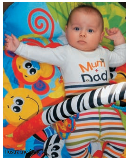
Ilustračné foto: (r)

Ponúkla mi svoju pomoc a vysvetlovala mi, ako dieťa rastie v matkinom lone. Ukázala mi obrázky a zdôrazňovala, že sme už rodičia a musíme si byť vedomí svojej zodpovednosti. Láskovým spôsobom ma prosila, aby som rýchlo priviedol svoju priateľku dole. Videla, že prichádzajú ďalší ľudia, a povedala mi: „Prosím vás, bežte hore po ňu, to predsa môžete spraviť. Ako správny muž musíte stáť za svojím dieťaťom. Prosím vás, nechajte svoje dieťa žiť, ono vám za to bude ďakovať každým svojím úsmevom!“ Jej oči sa zaliali