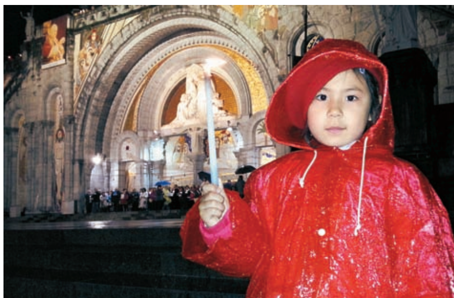
Na modlitbovej stráži v Lurdoch.

Za vašu podporu a vernosť sme vám veľmi povďační. Robíme to pre Pannu Máriu, a pre vás s potešením, že môžeme poslúžiť a že sme ňou boli prizvaní pomáhať v tomto duchovnom zápase - zápase nás všetkých.