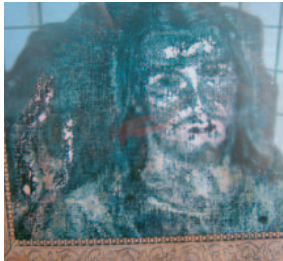
Obraz Ježiša nevytvorený ľudskou rukou

Ja keď niekedy kážem, a pozerám sa na tie tváre, ktoré stoja predom mnou, neviem, či mi vôbec rozumejú. Pretože chcem do ich srdiec vložiť tie slová, ktorá