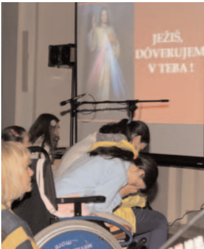
Božie Milosrdenstvo - nádej a istota pre každého z nás.

GOSPA NA SLOVENSKU * CESTA K POKOJU * V BOJI SO ZLOM * CHRÁŇME SI PASTIEROV * NAJVÄČŠÍ DAR