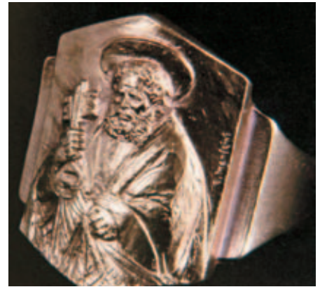
Rybársky prsteň (so sv. Jozefom) pápeža Františka, symbol pastiera Cirkvi.