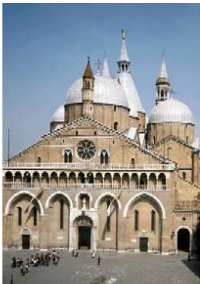
Bazilika sv. Antona (Assisi)