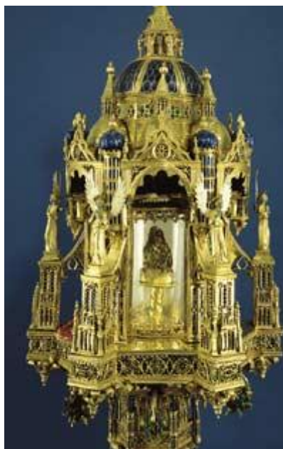
Relikviár so zázračne zachovalým jazykom sv. Antona