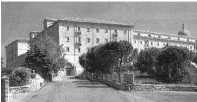
Kláštor na Monte Cassine

Svätý Benedikt sa narodil v roku 480, so svojou sestrou Scholastikou-dvojčat'om, v horskom mestečku Nursia (dnes Norcia), ktoré leží v terajšom stredotalianskom kraji Umbrii. Keďže chlapec prejavoval nadpriemerné rozumové schopnosti, bohatí rodičia ho poslali v sprievode pestúnky na vyššie štúdiá do Ríma. Benediktovi sa nepáčili mravy rímskych študentov. Preto po istom čase odišiel do kopcovitého kraja na východ od Ríma. Tu sa v osade Affile pripojil ku skupine askétov, ktorí žili v modlitbe a v sebazapieraní.