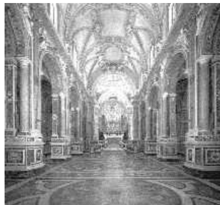
Vnútrajšok baziliky na Monte Cassine

Benedikt vynikal v asketickej horlivosti a čoskoro sa začali u neho prejavovať mimoriadne schopnosti, ktoré ho potom sprevádzali po celý život. Aby sa vyhol obdivu, uchýlil sa do odľahlej, ťažko prístupnej jaskyne v blízkosti Subiaca, kde žil životom tvrdého pokánia. Takto žil asi tri roky.