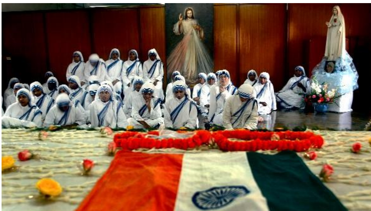
misionárky lásky pri hrobe Matky Terezy v Kalkate 5. septembra 2003, pri príležitosti šiesteho výročia úmrtia

Sestra Tereza opustila rehoľu, kde ako riaditeľka v nádhernom internáte učila dievčatá z bohatých rodín. „Tá zmena bola strašne tvrdá. V kláštore som také problémy nikdy nepoznala, nikdy mi nič nechýbalo. Naraz bolo všetko inak. Spala som, kde sa dalo, na zemi, často v chatrčiach, kde bolo veľa myší. Jedla som to isté, čo ľudia, ktorým som pomáhala, aj to len vtedy, keď vôbec bolo čo na zahryznutie.