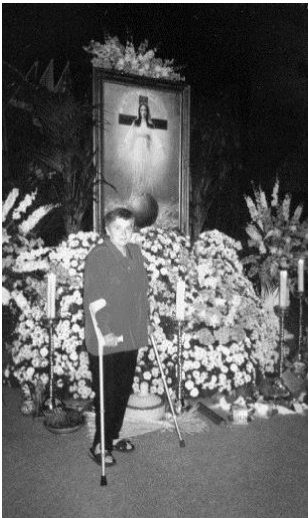
chorý a unavený.