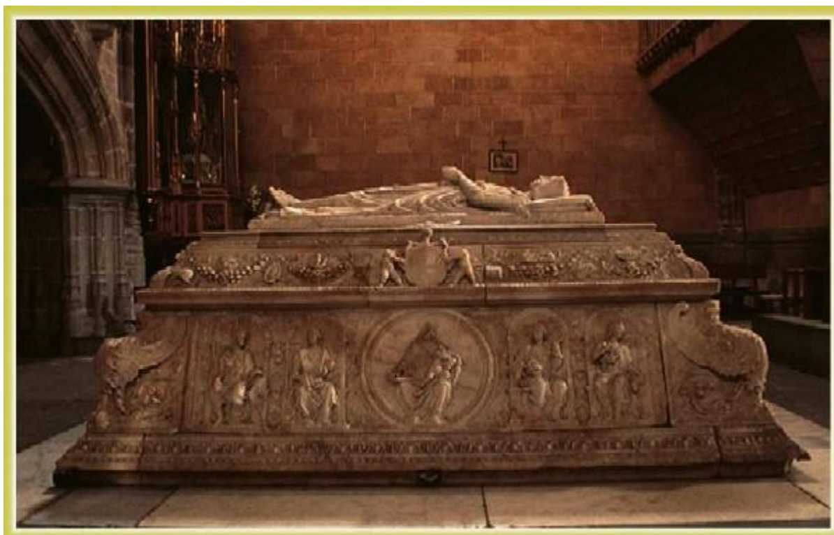
Hrob sv. Terézie z Ávily

„Pán vyžaduje, aby ho duša zakúsila len za vysokú cenu.“ Terézii veľmi záležalo na tom, aby nič nepovedala alebo nenapísala, čo by mohlo škodiť druhým ľuďom. Preto chcela, aby jej rukopis „Života“ prezrel sv. Ján z Avily, ktorý sa v tom čase pokladal za najpovolanejšieho muža v Španielsku hovoriť o duchovných veciach. Jej rukopis dostal roku 1568. Prečítal si ho a potom jej ho odovzdal so sprievodným listom, v ktorom ho chváli a schvaľuje.