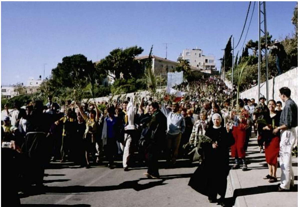
Palmový sprievod pokoja na kvetnú nedeľu v uliciach Jeruzalema