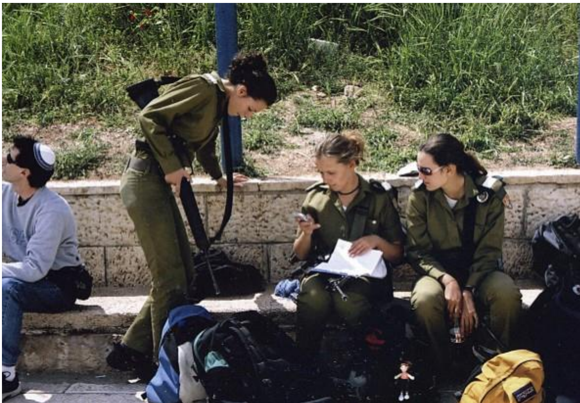
Izraelské dievčatá majú taktiež vojenskú povinnosť, tak ako chlapci

etnické až po politické. Strelbu však, tak ako to vídavame denne na obrazovkách, nepočuť. Zrejme máme šťastie. Len neodbytní Palestínčania strieľajú po nás neustále ponuky svojho tovaru, za všeobecnú cenu jedného dolára. Stoja pre hotelom, dobývajú sa do autobusu.