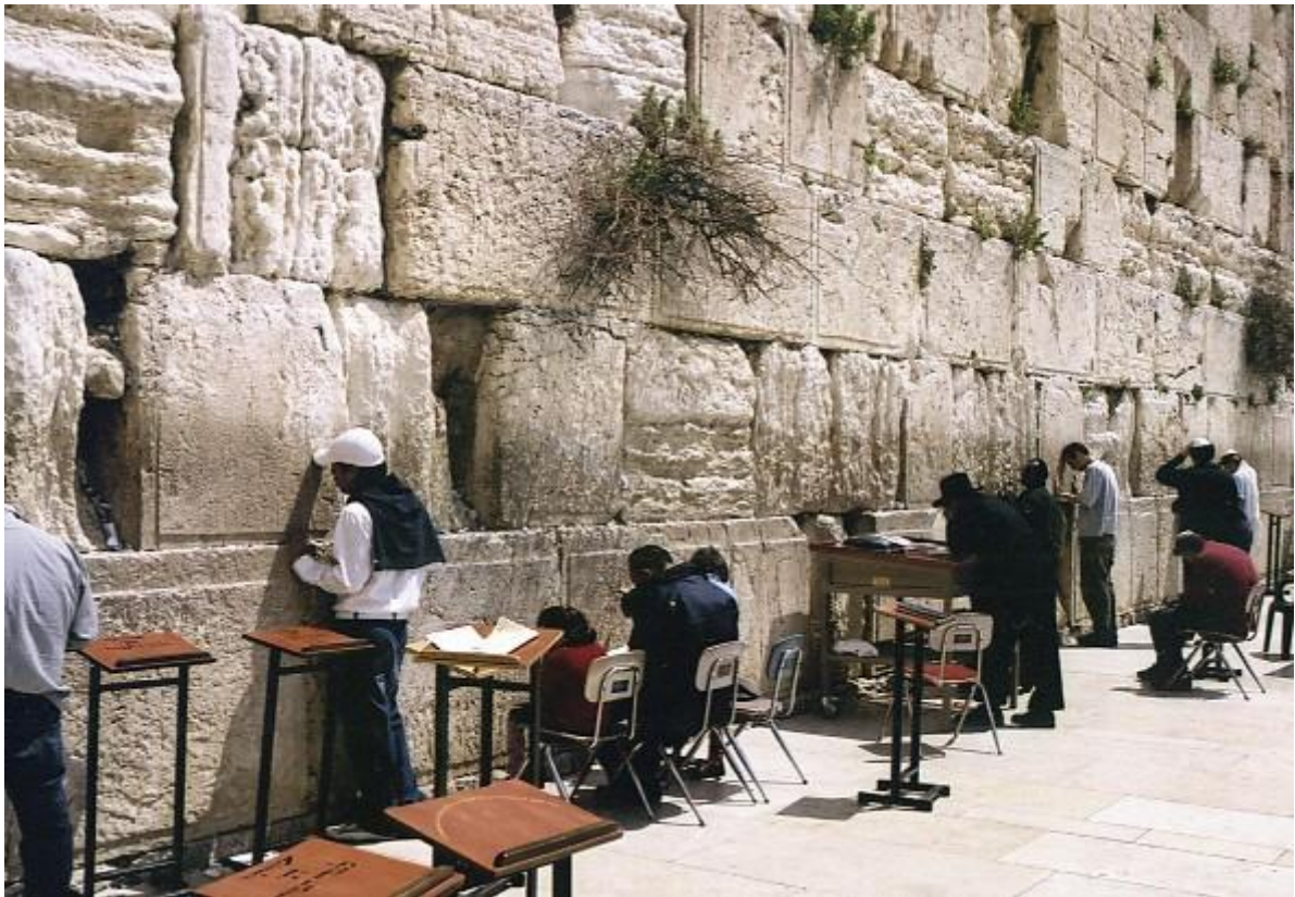
Múr nárekov v Jeruzaleme, kde židia rituálne oplakávajú svoju dávnu slávu

Neustále nároky Židov na ich krajinu nemajú opodstatnenie. Pretože v celej svojej histórii obývali krajinu úplne iba v priebehu niekoľkých storočí, a to za kráľa Dávida a Šalamúna, a potom za Herodesa. Ich vlasť je len fikciou. Pravdaže, Boh im slúbil túto zem, ale Božie prisľúbenie sa viazalo na zmluvu, na vernosť Božím prikázaniam. Židia však majú problémy so zlatým teľaťom - až po dnešné dni. Božie požehnanie ich preto obchádzalo. Dnes je umelo vytvorený štát rozparcelovaný medzi Izraelcov a Palestínčanov. Na krajinu majú nárok všetci, ktorí tu žijú. Niektorí však akoby neustále živil a zároveň tlmil napätie, prichystané na deň, hodinu, ktorá bude rozhodujúca.