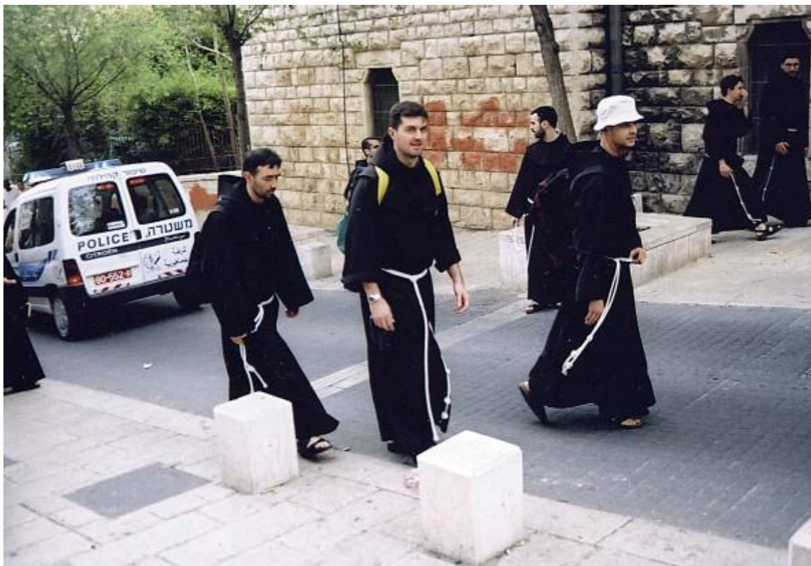
Bratia františkáni, stároční kustosí svätej zeme sa tu vôbec nenudia

Kresťanské chrámy a kostolíky v Izraeli striedajú synagógy a mešity, z ktorých každé ráno ťahavým hlasom vyspevujú muezíni. Tlak moslimov na kresťanov tu je tiež veľký. A tak kresťania utekajú poväčšine do zahraničia. Tí zahraniční kresťania sa sem chodia pozeráť, a navštíviť svätá miesta ako skôr múzeum svojej viery. Ešte že nasvätejšie miesta kresťanov sú tu v rukách františkánov. Nad Jeruzalemom je už jasná nočná obloha. A akoby sa nad mestom pokoja stále týčil kríž Ježiša, Kráľa pokoja, ktorý nad ním zaplakal, nad mestom, ktoré tlie ako rozbuška Apokalypsy.