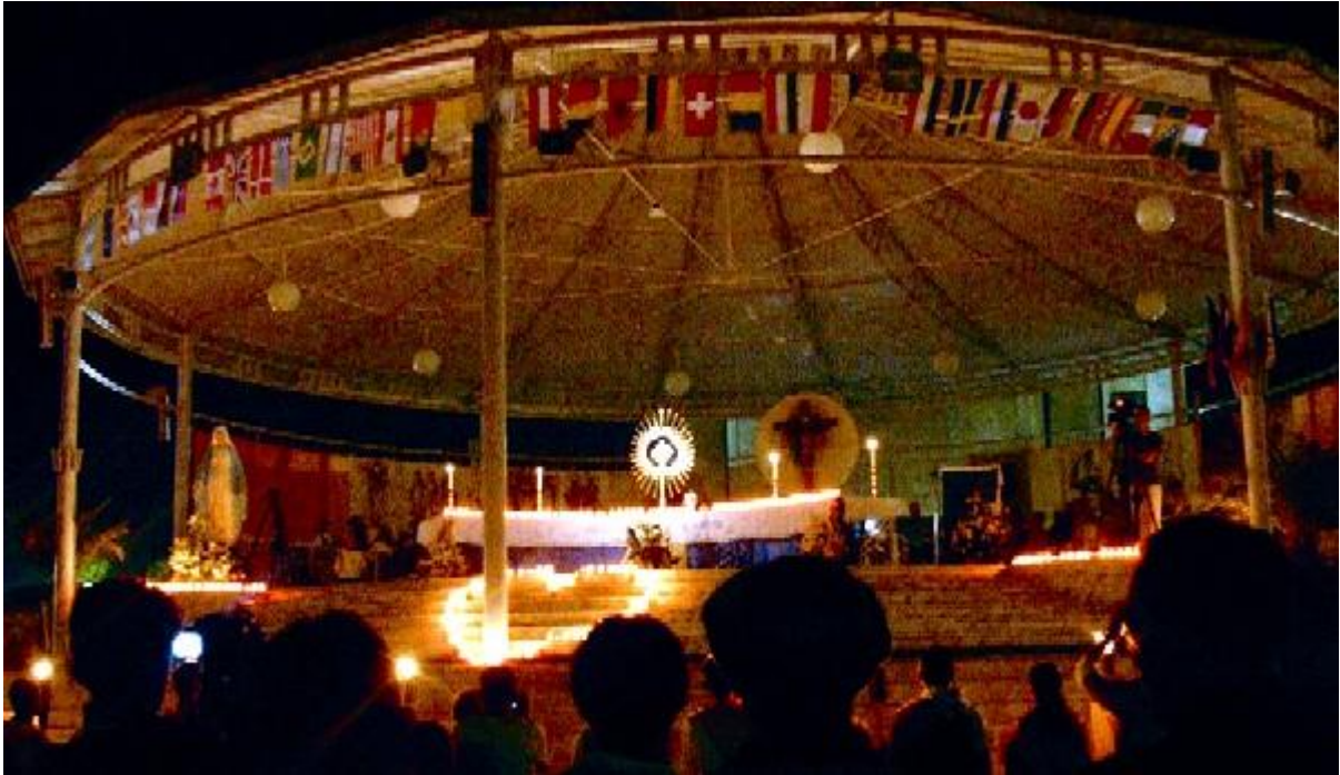
Adorácia Najsvätejšej Sviatosti v Medžugorí