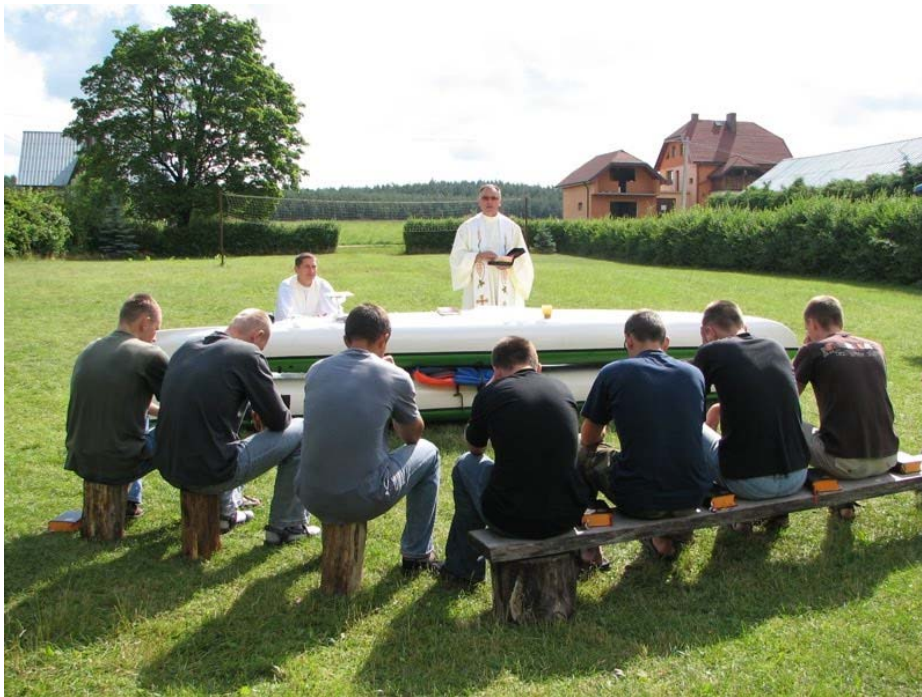
Czarna Hańcza, Mazury - Poľsko