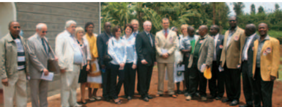
Kolektív pracovníkov a donorov Nemocnice sv. Cyrila a Metoda v Keni.