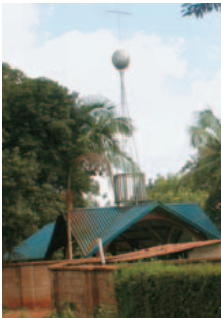
Kostolík Panny Márie.