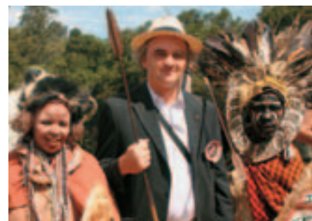
Uprostred afrického folklóru.

Pani si želala, aby bol postavený kostol. Neznámy hlas jej oznámil: „Kostol sa bude volať „Mária Nepoškrvená“.