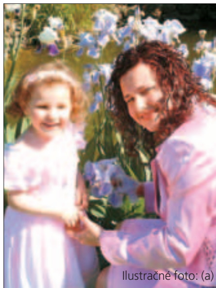
Ilustračné foto: (a)

Ešte k „duchovnému terorizmu“. Po írskom referende politológ Michal Horský