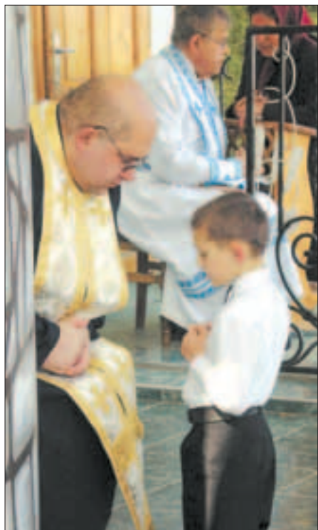
Panna Mária aj vo svojom zjavení v du Laus zdôraznila pokánie .