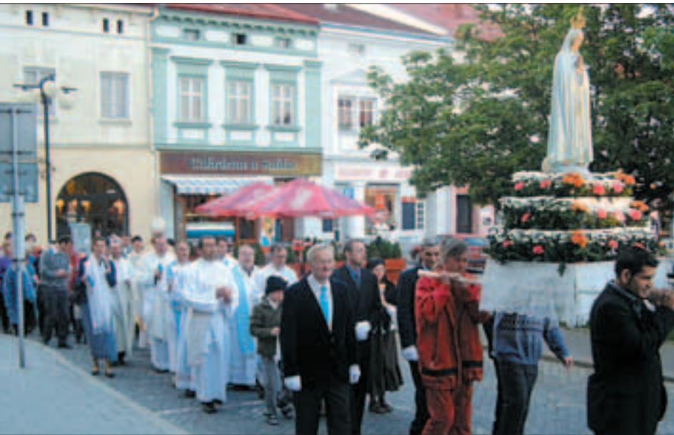
Verejný sprievod s Pannou Máriou - svedectvo o aktivite Jej detí vo svete.