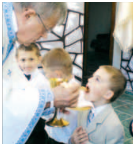
Sv. Prijímanie je prípustné iba po dobrej sv. spovedi.

Benoite si vzala k srdcu poslanie, ktoré jej Panna Mária uložila - pripraviť hriešnikov na prijatie sviatosti Pokánia. Často povzbudzovala dvoch kňazov, pridelených do svätej, aby prijímali pútnikov z láskavosťou, trpezlivosťou, špeciálne láskavo aby zaobchodili s najväčšími hriešníkmi a tak ich povzbudili k ľútosť nad hriechmi. Iba Boh môže odpúšťať hriechy. A keďže On je Synom Boha, hovorí Ježiš o Sebe: „Syn človeka má na zemi moc odpúšťať hriechy“ a uskutočňuje túto božskú moc: „Tvoje hriechy sú odpustené.“ V tejto sviatosti, kňaz, musí