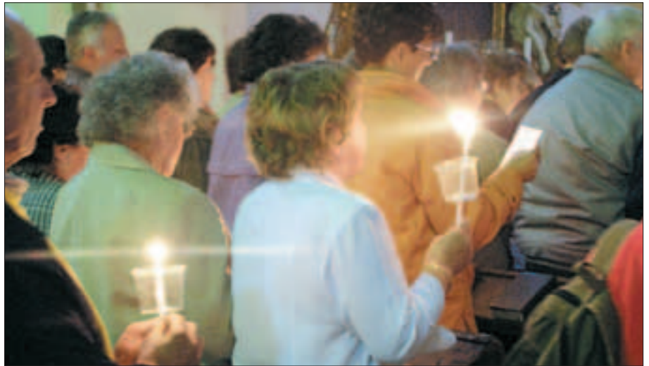
Mariánski aktivisti sa na stretnutí vo Val. Meziříčí zasväcujú Panne Márii.

My dnes vytváříme společenství Církve. Ježíš si nás vyvolil, vybral. Je to naše obecné kněžství. To co teď zde probíhá, tohle nepřipravil ani jeden jediný kněz, ani jeden biskup, ale vy. Laici. Slovo laici někomu zní jako „pleveľ“. Ale laici nejsou plevle, laici jsou také kněží. A z toho plyne také moje