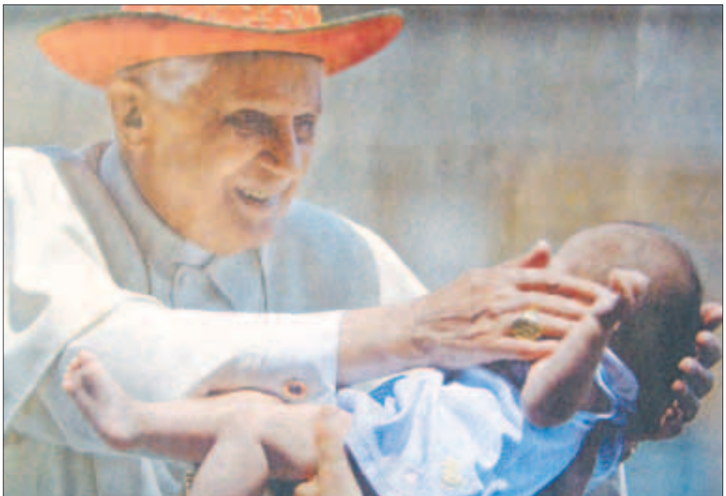
Pápež Benedikt XVI. na audiencii 18. 6. 2008 prijíma a požehnáva novorodené dieťa.