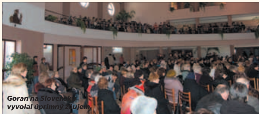
Goran na Slovensku vyvolal úprimný záujem.

vytiahol som pištoľ, otočil ju proti hlave a vystrelil. Padol som na zem. Zrazu sa otvorili dvere, prišli susedia a odviezli ma do nemocnice. Operovali ma, a keď som sa zobudil, bola pri mne moja druhá matka a povedala, že všetko je v poriadku. Po nejakých 10 dňoch som vyšiel z nemocnice. Bol som nahneván na seba, že sa mi nepodarilo zabiť sa. Môj otec mi povedal, že guľku mi z hlavy vytiahli. Ale