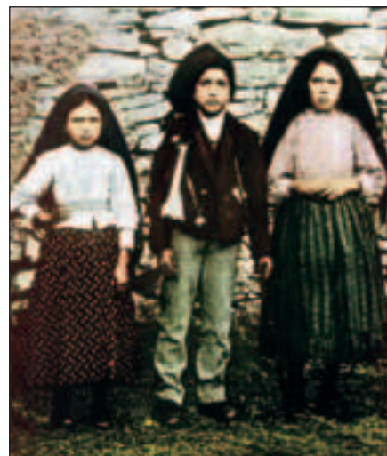
Hyacinta, František a Lucia - vizionári z portugalskej Fatimy.

Tu vás zhromažďujem všetkých okolo seba a dávam vám cítiť svoju radosť z toho, že ste prijali pozvanie pa-