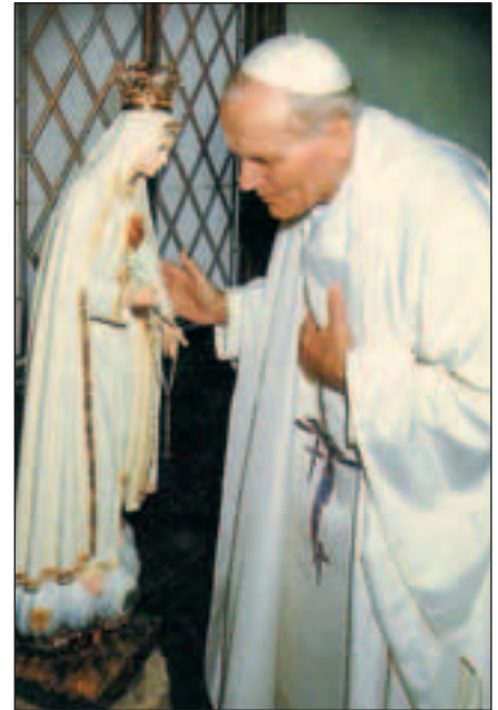
Ján Pavol II. bol „pápežom Fatimy“.

V Cirkvi sa dovŕši veľký odpad, ktorý sa rozšíri na celom svete. Rozkol sa naplní